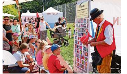
Sirup-Bar, Slackline, Seifenblasen, Ballonkünstler und mehr - Langeweile war beim Familienfest am Nachmittag ein Fremdwort.