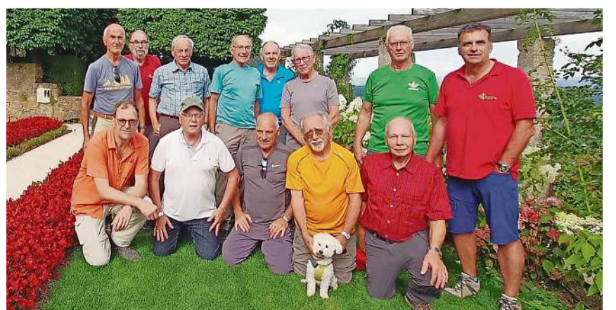
Gruppenfoto im idyllischen Schlossgarten.