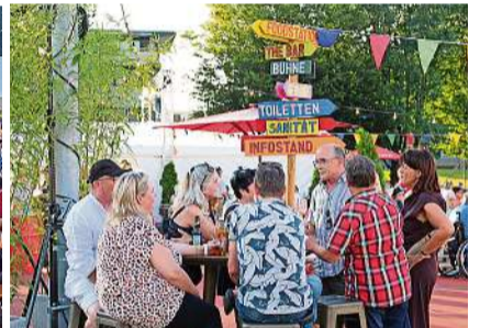
Vor dem Konzert genossen die Mitglieder der Raiffeisenbank am Eppenberg den schönen Sommerabend mit kulinarischen Leckerbissen von den Foodstationen.